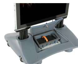
Standfuß mit Rollen und Batterie